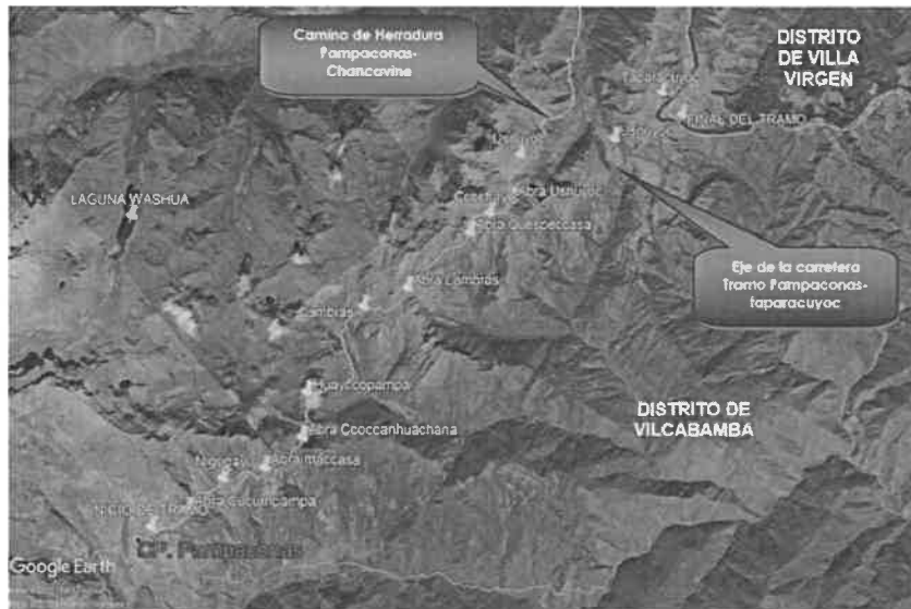
Imagen N°01 MAPA LOCALIZACIÓN CARRETERA PAMPACONAS-TAPARACUYOC