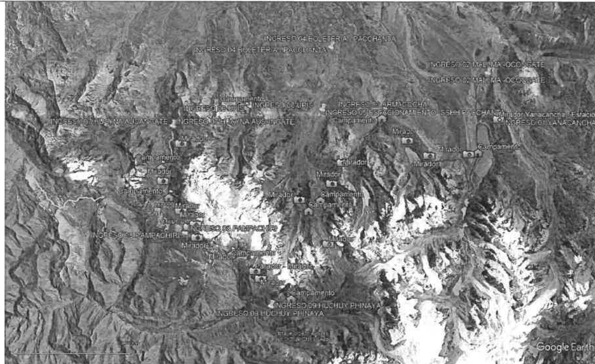
ILUSTRACIÓN N°1 UBICACIÓN DEL TRAMO DEL PROYECTO A INTERVENIR

"AÑO DE LA ESPERANZA Y EL FORTALECIMIENTO DE LA DEMOCRACIA"